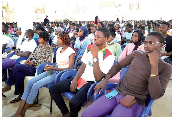
Table ronde nationale sur l'éducation chrétienne

de l'Enseignement Supérieur, afin d'en apprendre davantage sur le bon choix pour leur enseignement supérieur en ce qui concerne leurs compétences et les exigences du marché. Les jeunes ont été autonomisés grâce à des séances de coaching et d'orientation personnalisées.